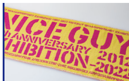
フラット織 ロット:50枚~/納期:約1ヶ月/校正:約2週間