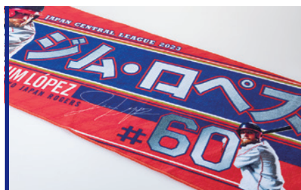
フルカラープリント (インクジェット) ロット:10枚~/納期:約3週間/校正:約2週間

プロスポーツ球団、有名テーマパーク、メーカー、アパレルブランド、 外資系SaaS企業、地方自治体など豊富な実績を持っています。