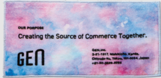
NEW!!! ハーフミニ 20×10cm

企業ノベルティとして配りやすい高品質なミニタオル。フルカラー表現が可能で、カラフルなロゴも表現できます。ハーフミニサイズが新登場!