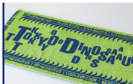
毛違いジャガード織 ロット:100枚~/納期:約1ヶ月/校正:約3週間