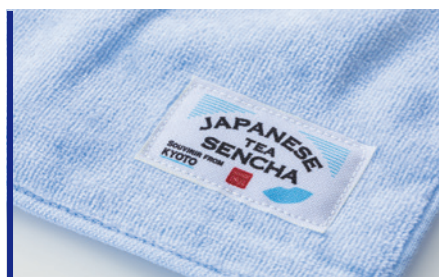
プリントネーム ロット:100枚~/納期:約1ヶ月/校正:約2週間