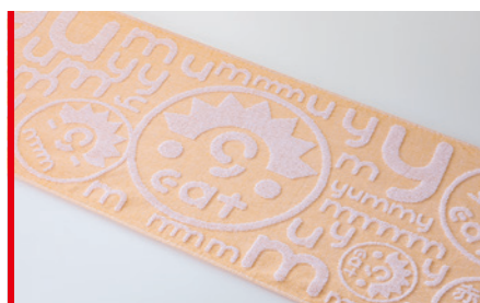
上げ落ちジャガード織 ロット:300枚~/納期:約1ヶ月/校正:約3週間