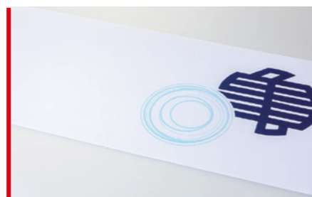
てぬぐい ロット:100枚~/納期:約3週間/校正:約2週間