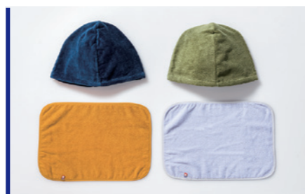
タオル地アイデアグッズ