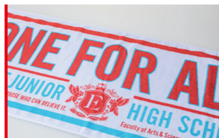
シルクスクリーンプリント ロット:100枚~/納期:約3週間/校正:約2週間